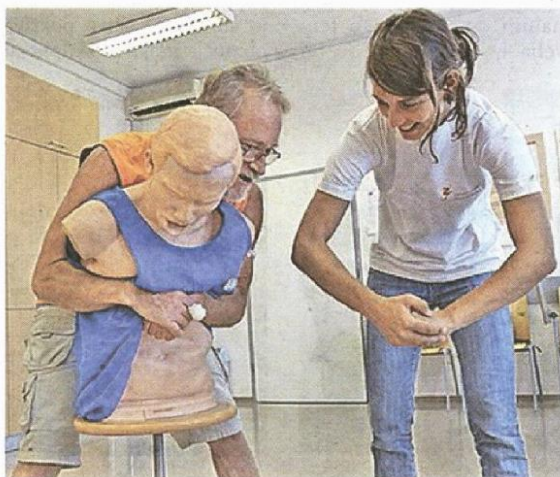
Na tečaju prve pomoči za starejše